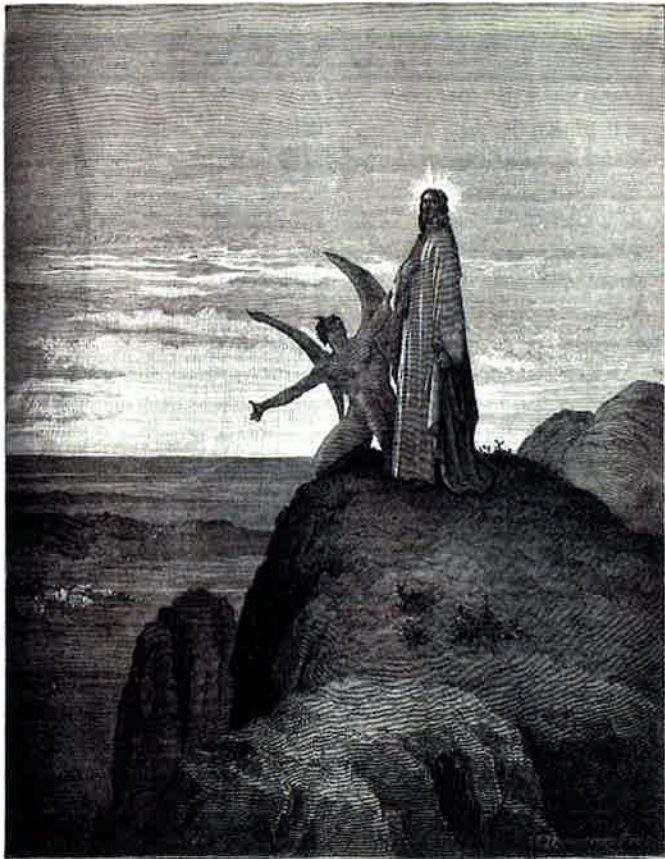
THE TEMPTATION OF JESUS

Deuteronomy 26:16-19, Psalm 119:1-2, 4-5, 7-8, Matthew 5:43-48