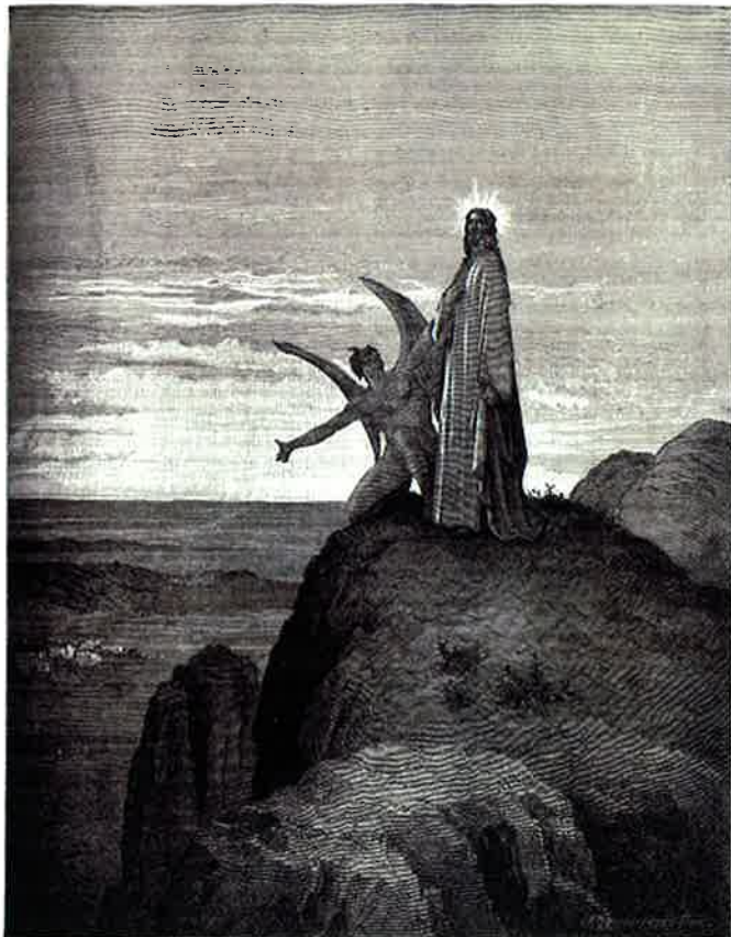
THE TEMPTATION OF JESUS.

Deuteronomio 26, 16-19, Salmo 118, 1-2. 4-5. 7-8, Mateo 5, 43-48